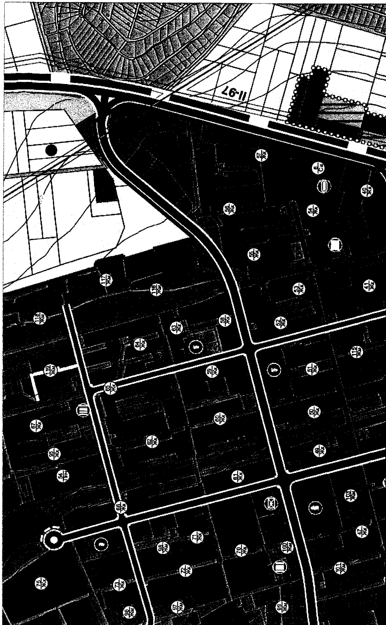
Извадка - фрагмент от ОУПО гр. Добрич с нанесено с точка местоположение на ПИ 72624.207.14 Имотът е земеделски.