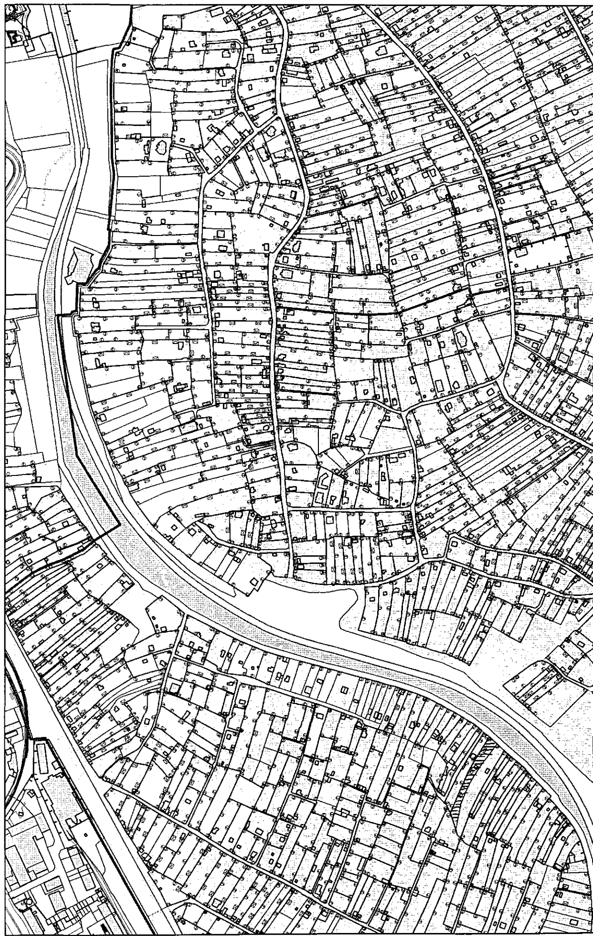
Местоположение Разрешаване изработване на ПУП-ПЗ за ПИ 72624.902.310 в местността "Гаази баба" гр.Добрич М=1:5000