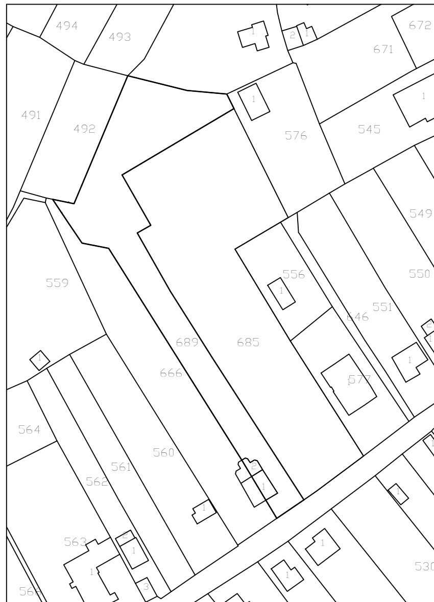
ИЗВАДКА ОТ КАДАСТРАЛНА КАРТА за ПИ 72624.905.689, местност "Гаази баба" гр.Добрич М 1/1000