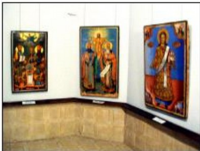
Иконна зала, Художествена галерия