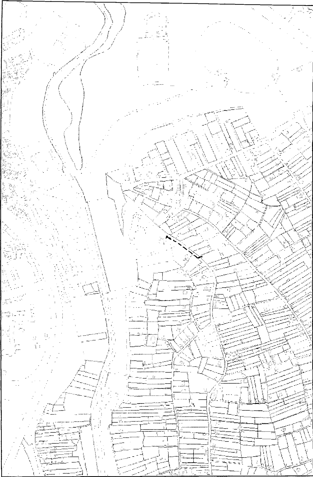
Разрешаване изработване на ПУП-ПП за ПИ 72624.904.440 във връзка с изграждане на канализация на ПИ72624.904.525